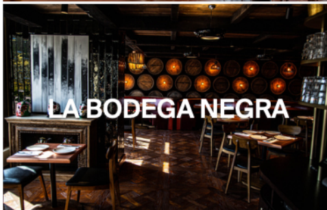
LA BODEGA NEGRA